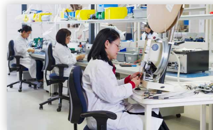
Unsere Produktion in den Niederlanden