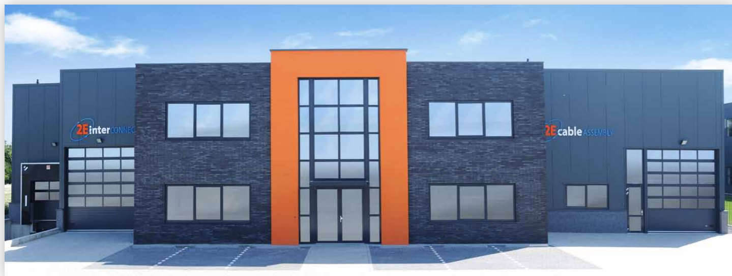
Unser Hauptsitz in den Niederlanden