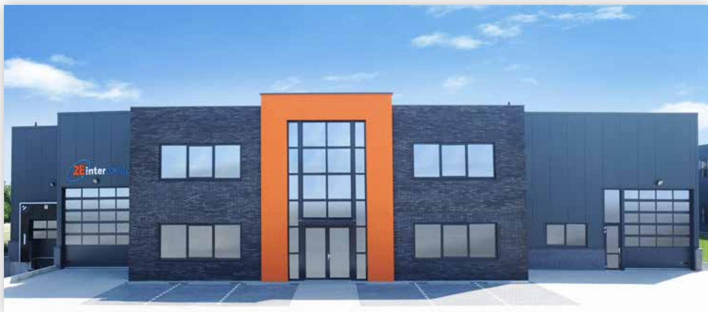
Ons hoofdkantoor in Nederland