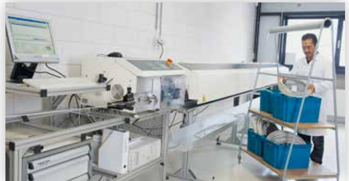
Onze productieafdeling in Nederland